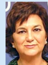
MATILDE VALENTÍN “El bienestar social es una prioridad para el Ejecutivo”