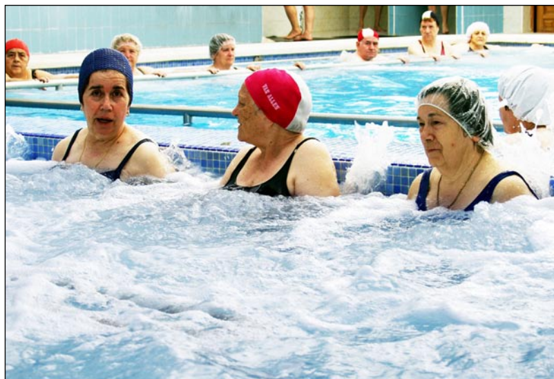
El Plan de Ajuste puesto en marcha por el Gobierno de María Dolores Cospedal ejecutará la extinción del Instituto de Promoción Turística Don Quijote; así como la suspensión temporal de los programas de Termalismo y Turismo Social llevados a cabo por la Consejería de Salud y Bienestar Social, entre otras medidas.

prestación de los servicios. El importe del ahorro estimado es de 12.000.000 de euros.