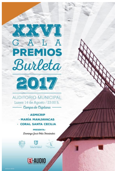
Cartel Anunciador 2017 – Imprenta Díaz-Hellín

No se podrá desvelar de forma pública por ningún medio la identidad del autor mientras dure el concurso o hasta que se haga público el nombre del ganador.