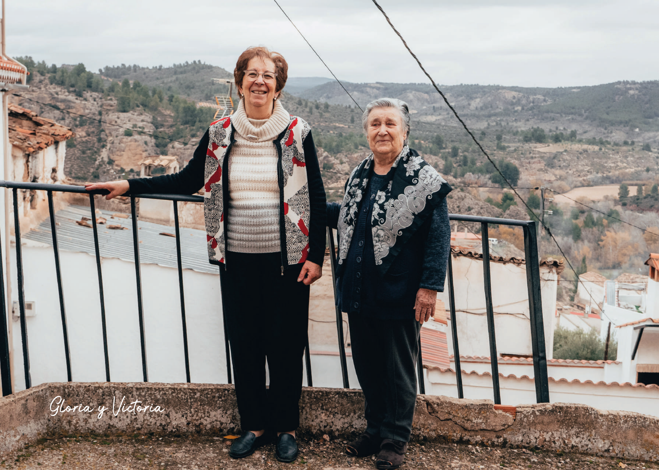
Gloria y Victoria