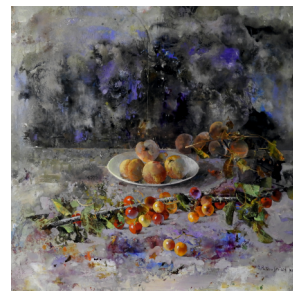
Rama de cerezas Ángel Pintado