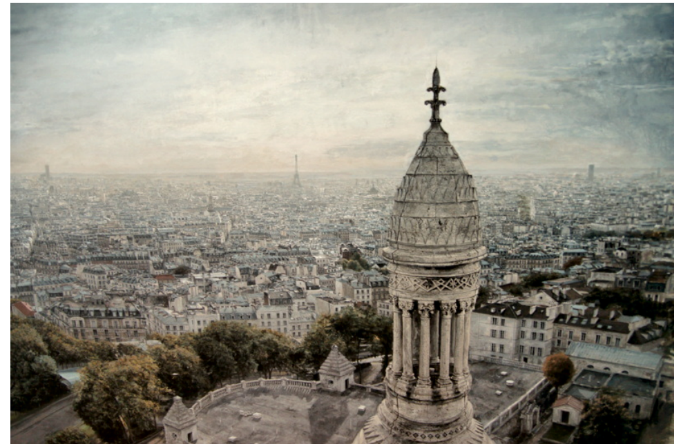
Vista de París