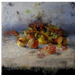
Mesa con granadas Ángel Pintado