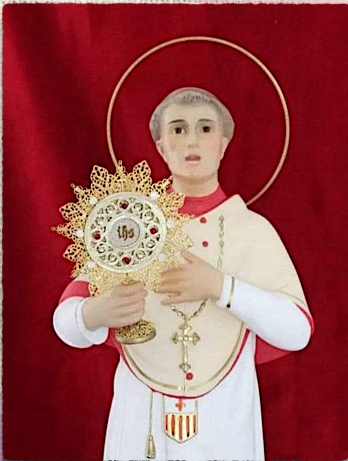
SAN RAMÓN NONATO PATRÓN DEL BARRIO DE MATERNIDAD