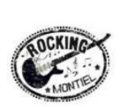
Asociación Rocking Montiel